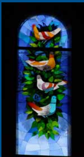
vitrail de Saint Pierre, Moirans