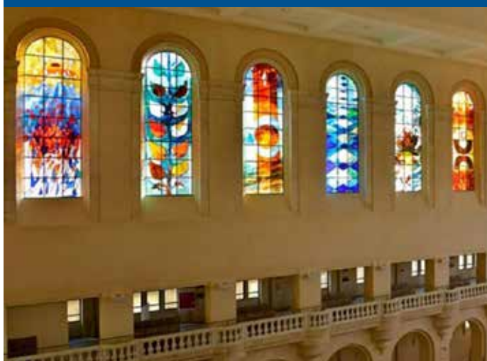
Vitraux de la basilique du Sacré-coeur, Grenoble, dernière oeuvre d'Arcabas sur le thème de la création.