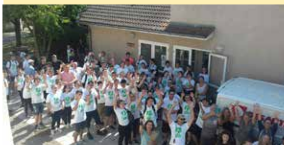
Les étudiants avant le départ.

Dès 14 heures, la feuille de route du rallye patrimonial a été distribuée à chaque groupe de jeunes. Ils avaient la possibilité de s'aider de l'auto-guide édité par MTT. Au programme, des questions et des énigmes à élucider afin de se familiariser avec le patrimoine de Moirans, leur nouvelle ville d'adoption. Tous les jeunes ont véritablement apprécié cette journée d'intégration. L'ambiance bon enfant fut cependant studieuse.