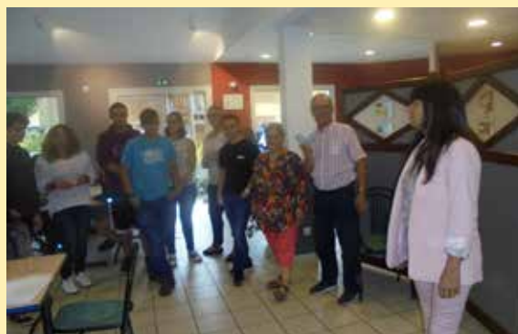
Lots de consolation pour tous