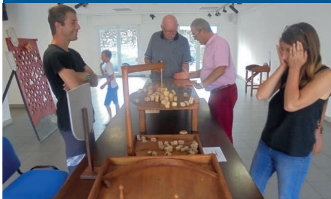
Avec nos jeux médiévaux, les enfants s'amuseent, même les grands