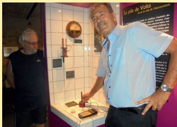
Robert nous fait découvrir l'ancêtre de nos piles, la pile VOLTA