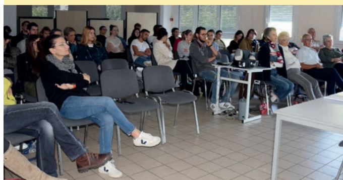
Des étudiants des plus attentifs