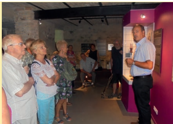
Un chimiste parle aux moirannais

Enfin, les visiteurs contents de leur sortie se sont souhaité un bel été et ont promis de se retrouver à la rentrée de septembre, des projets plein la tête.