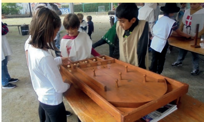
Nos jeux médiévaux ont rencontré un vif succès