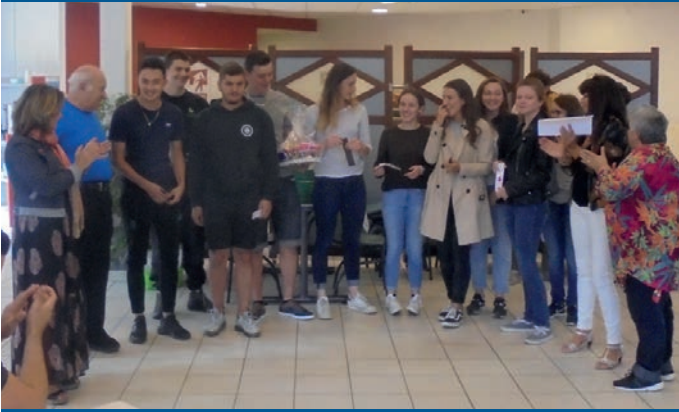
L'équipe gagnante connaît Moirans mieux que sa poche, maintenant

La 2ème phase de l'intégration de MFR s'est déroulée lors d'un repas pris en commun à midi. L'annonce du palmarès des équipes fut un moment fort apprécié par les étudiants gratifiés de nombreuses récompenses. Nombreux lots aux gagnants (9 groupes récompensés). Les étudiants ont cependant regretté de n'avoir pu visiter l'église St Pierre, inaccessible pour raisons de sécurité.