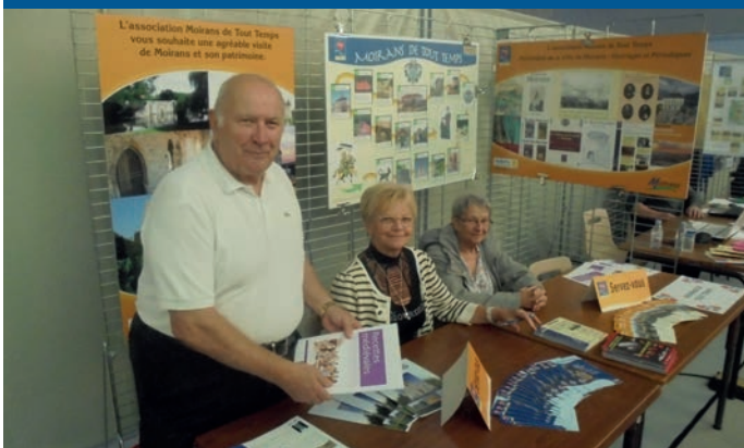
MTT fidèle au forum

Notre association était présente au forum des associations, parmi 50 autres ; des personnalités nous ont fait l'honneur de visiter notre stand. Ainsi, notre sénateur et conseiller départemental, M. André Vallini, nous a complimentés pour notre engagement au service de nos adhérents. Même si les temps sont difficiles, il nous a encouragés à continuer sans faiblir l'organisation de manifestations. Nous avons aussi reçu de nombreuses félicitations de la part des visiteurs. Notre livret de recettes du moyen-âge et notre autoguide ont remporté un tel succès que tous les intéressés n'ont pas pu être satisfaits.