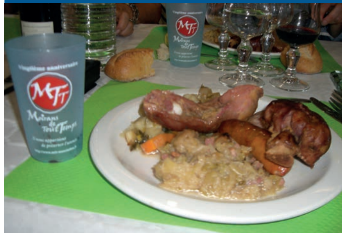
Pleins feux sur la potée moirannaise