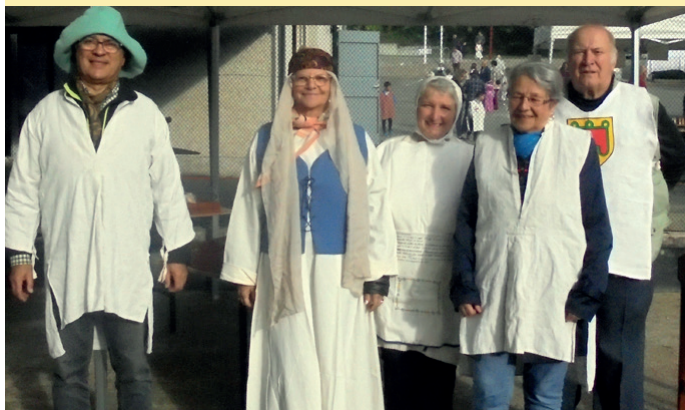
Aux médiévales enfantines, même les grands pouvaient se déguiser

Une grande journée, « les médiévales enfantines » organisée pour la 5ème fois, par la Maison Pour Tous (MPT) de St Jean de Moirans, avec la participation des écoles Vendémiaire et du Sacré Cœur, de la compagnie Excalibur Dauphiné, des Goliards et de notre Association M.T.T avec notre stand de jeux en bois et nos excellentes crêpes. Rendez vous est pris pour une prochaine édition.