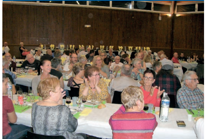
ambiance chaleureuse pour notre vingtième anniversaire; on a fait même tourner les serviettes