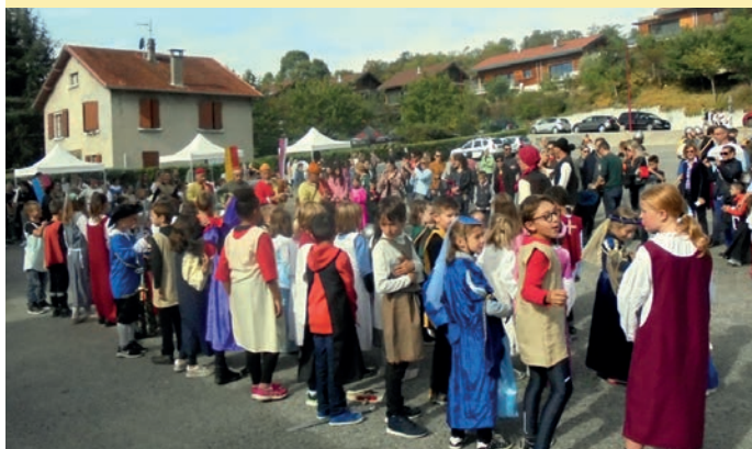
Grande affluence et météo favorable pour ces médiévales enfantines