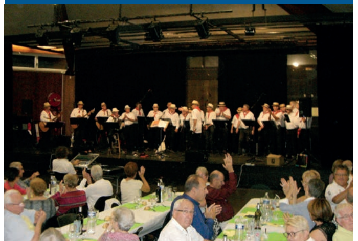
Les «Tire-Bouchons» ont conquis l'assemblée