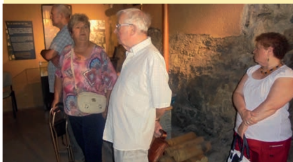
l'auditoire est attentif